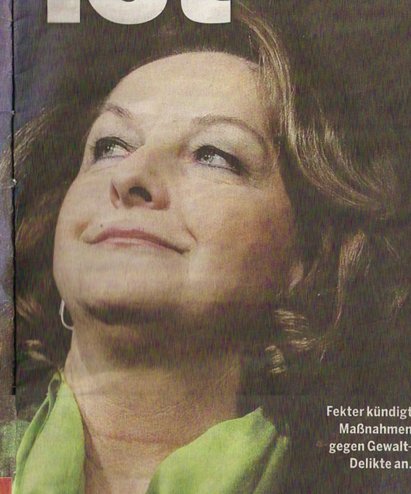
Fekter kündigt Maßnahmen gegen Gewalt-Delikte an.