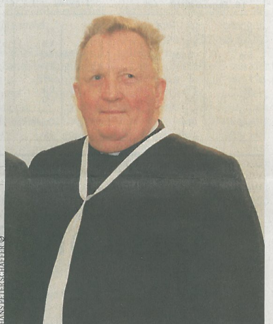
Opfer Pater Benno: Einbruch am 26. Dezember

Seitenblicke-Bande Fälle wie diese mit prominenten Opfern führten dazu, dass manche Boulevardmedien gleich eine ominöse „Seitenblicke-Bande“ für die Einbrüche verantwortlich machten. Tatsache ist, dass die Täter Wohnungen in guter Innenstadt-Lage im Visier hatten. Adressen, an denen sie annehmen, dass dort viel zu holen ist.