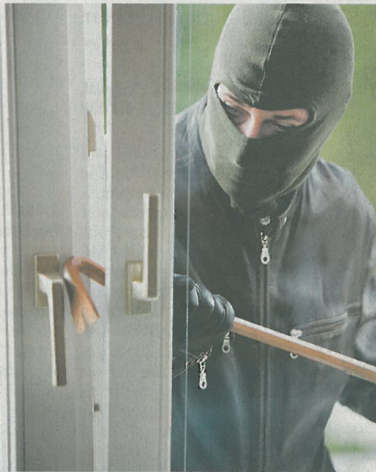
Auf Beutezug: Die Täter waren hochaktiv