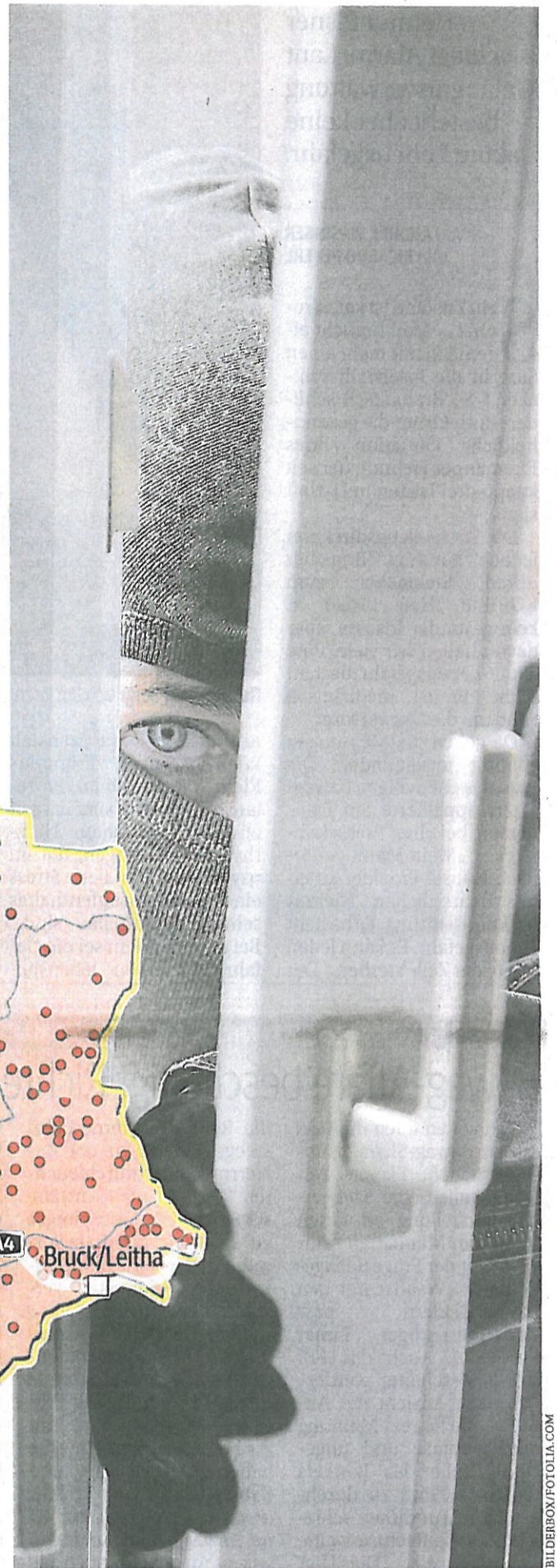
Einbrüche in Wohnhäuser sind in NÖ um 31 Prozent gestiegen